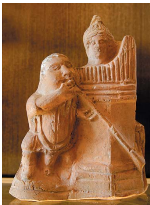
Músicos tocando una salpinge y una hidráulide. Terracota. S. I d.C. Museo del Louvre. ( http://commons.wikimedia.org/wiki/File:Salpinx_hydraulis_players_Louvre_CA426.jpg )

Entre los instrumentos de viento el principal era el aulós , que se remonta al s. VIII a.C. y cuya invención atribuían a la diosa Atenea, que lo arrojó lejos de sí al darse cuenta de que, al soplar, se le afeaba la cara. Era una especie de flauta con lengüeta, que solía tener incorporada una correa de cuero, la forbeia , que pasaba por los labios, rodeaba las mejillas y se ataba por detrás de la cabeza, para mitigar el cansancio. Tenía