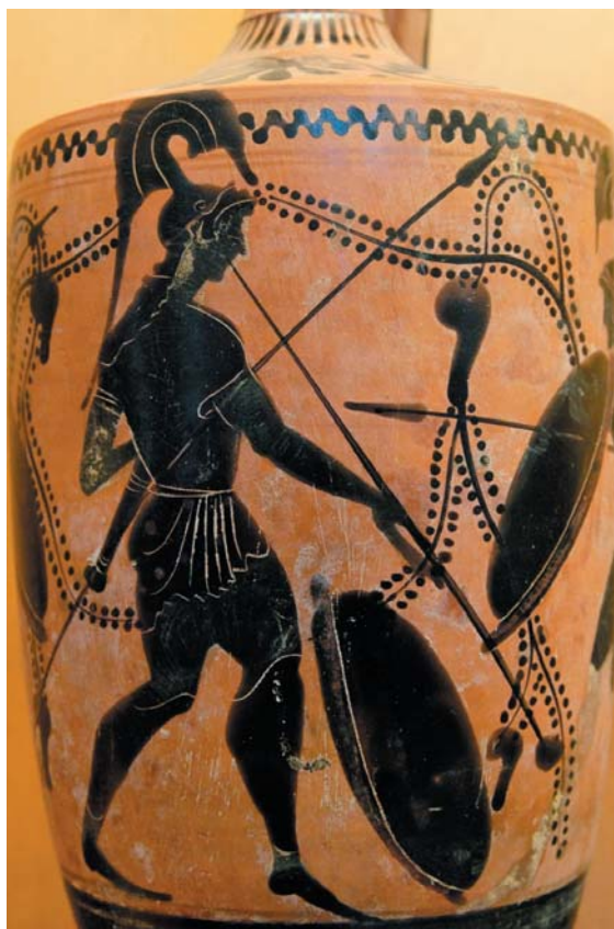
Soldado tocando una salpínge. Lécyto griego de figura negra. S. VI-V a.C. Museo arqueológico de Palermo.