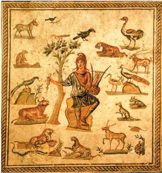
Mosaico de época romana que representa a Orfeo tocando su lira mientras toda clase de animales escuchan embelesados.

En otro mito, Lino, hijo de Anfimaro y una musa, sustituye las cuerdas de lino de la lira por otras de tripa, mejorando su sonoridad. Orgulloso de su genio, desafía al propio Apolo en canto. El dios, furioso por su atrevimiento y envidioso de su logro, le da muerte. En un tercer mito, Anfión, hijo de Zeus y Antíope, recibe de Apolo en su nacimiento el regalo de una lira , con la que adquiere tal maestría que, cuando levanta las murallas de Tebas con su hermano gemelo Zeto, mientras éste arrastraba las piedras con su gran fuerza, Anfión las transportaba haciéndolas flotar con la poderosa magia de su música.