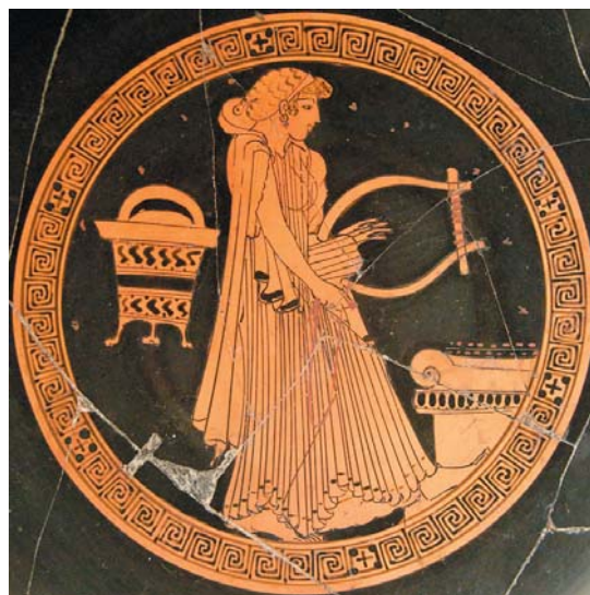
Mujer tocando una cítara. Cílice ática de figura roja. S. V a.C. Biblioteca Nacional de Francia. ( http://commons.wikimedia.org/wiki/File:Woman_kithara_CdM_581.jpg )

En época arcaica (s. VIII-VI a.C.) aparecen los nomos ( leyes ), vinculados al poeta-músico Terpandro de Lesbos (s. VII a.C.). Eran unas normas que determinaban las composiciones de voz e instrumento, de diverso tipo y gran variedad de ritmos. Destaca el nomos ideado por Arquíloco de Paros (s. VII a.C.), que consistía en el acompañamiento musical de un poema yámbico con ritmo rápido y en la intervención añadida de un solista entre las estrofas que, a veces, introducía notas discordes, es decir, que no se ejecutaban a la vez que la melodía principal. Es lo que se ha llamado heterofonía , es decir, una sola línea musical con distintas voces que emitían diferentes variaciones de dicho tema mediante adornos espontáneos o fraseos individuales. No se trata de polifonía o varias voces, que los griegos no conocían, pues la audición de varios sonidos simultáneos que producen un acorde, es decir, la armonía, no empezará a aparecer hasta la baja Edad Media y no quedará definida hasta los siglos XVII-XVIII.