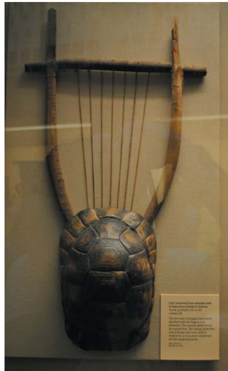
Quelis. Museo Británico.

Por último, ligado a Dioniso y su culto orgiástico, encontramos el mito de Pan y otro instrumento de viento, la siringa o flauta de Pan. Este dios de los pastores y rebaños, mitad hombre velludo, mitad macho cabrío, y de sexualidad desenfadada, por lo que fue incluido en el cortejo de Dioniso, se enamoró de una ninfa llamada Siringa. Ésta, horrorizada por su fealdad, huía en cuanto lo veía. En cierta ocasión, Siringa, acorralada por Pan, se arrojó a la corriente del río Landón y suplicó ayuda a los dioses, que, conmovidos, la convirtieron en un cañaveral. Pan, desconsolado, decidió cortar algunas de las cañas y construir con ellas un nuevo instrumento musical, al que llamó con el nombre de su amada. Su música es dulce y melancólica, por ello, y vinculada a los pastores y la poesía bucólica.