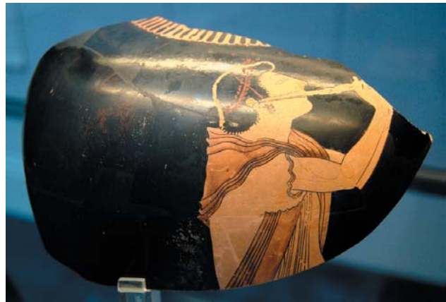
Auleta tocando un aulós con forbeia. Fragmento de una ánfora de figura roja. S. VI a.C. Museo de antigüedades de Munich.

La música, interpretada por aulós , servía para llevar a la cumbre la intensidad de los sentimientos, pues sólo la melodía puede seguir expresando emoción cuando el alma humana, profundamente conmovida, sólo puede emitir gritos y sonidos inarticulados. Por ello, letra y música, melodía y poesía debían ser creados al mismo tiempo. En la comedia se introdujeron ritmos y melodías populares, aunque, parece, la calidad de la música era menor que en la tragedia por la relajación del aulós , el exceso de semitonos y el abuso de cambios de modulación.