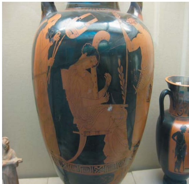
Mujer tañendo una sambuca. Museo Británico.

Como ya hemos dicho, la base de la música griega era la cuarta, el intervalo natural de la voz humana, ordenando los cuatro sonidos del tetracorde descendientemente. La forma de ordenación de los tres intervalos entre esos cuatro sonidos o notas son los modos . Así, en el género diatónico hubo tres modos: el dorio , que correspondería a nuestra escala de mi (mi, re, do, si, la, sol, fa, mi), con semitonos entre do y si, y fa y mi; el frigio , que se identifica con nuestra escala de re (re, do, si, la, sol, fa, mi, re); el lidio , que sería la actual escala de do (do, si, la, sol, fa, mi, re, do). Luego se añadió un cuarto, el mixolidio (si, la, sol, fa, mi, re, do, si). Cada uno de estos modos tenía un modo secundario, a una quinta abajo o a una cuarta arriba ( hipodorio , la, sol, fa, mi, re, do, si, la; hipofrigio , sol, fa, mi, re, do, si, la, sol; hipolidio , fa, mi, re, do, si, la, sol, fa; hipomixolidio , mi, re, do, si, la, sol, fa, mi). Pero no es tan simple, porque en los tres intervalos de cada tetracorde había un leima , que es menor que nuestro semitono, aunque no está determinado en qué cuantía.