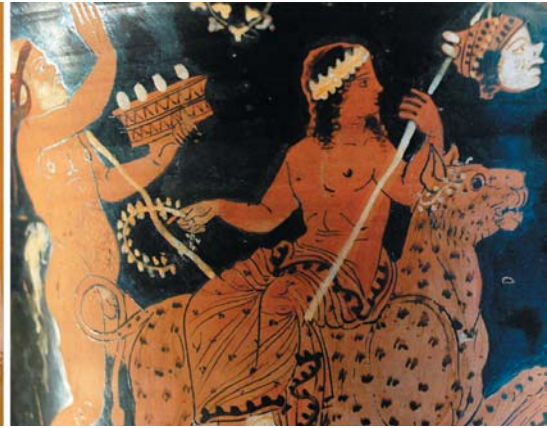
Dioniso montado en una pantera. A la izquierda un sátiro tocando un roptron. Cratera ática de figura roja. S. IV a.C. Museo del Louvre. ( http://commons.wikimedia.org/wiki/File:Dionysos_panther_Louvre_K240.jpg )