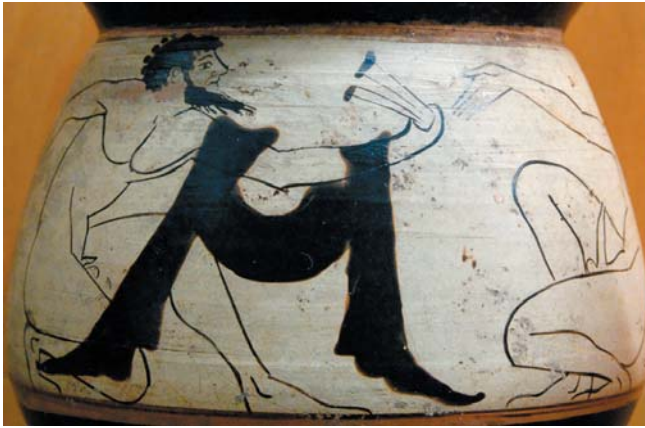
Hombre tocando unos crótalos. Vaso ático pintado con fondo blanco. S. VI a.C. Museo arqueológico de Palermo.