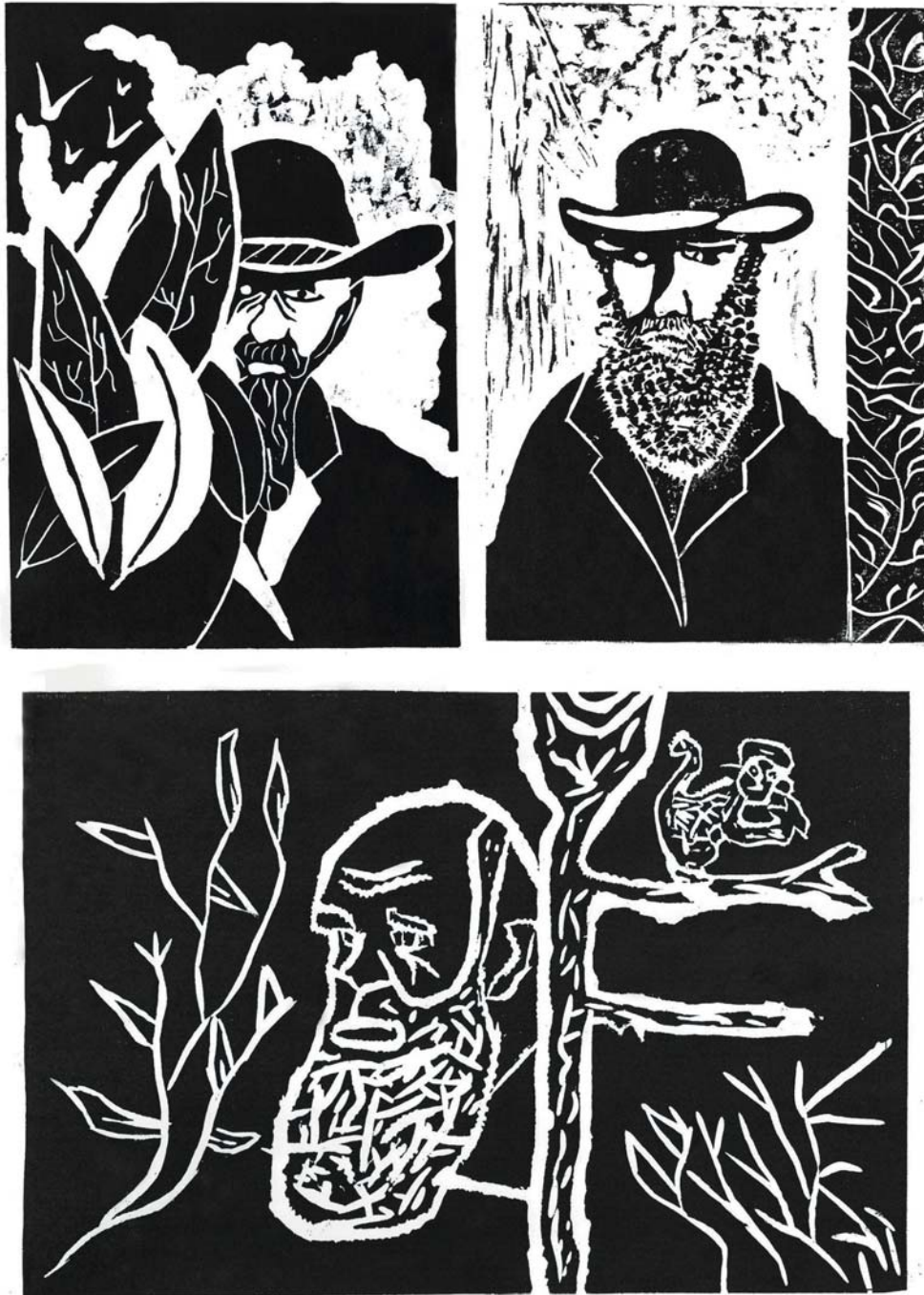
Linograbados sobre la figura de Charles Darwin elaborados por alumnos de la asignatura de Educación Plástica y Visual en el marco de las actividades conmemorativas del bicentenario del nacimiento de Darwin y del 150 aniversario de la publicación de El Origen de las Especies .

Una vez que el dibujo está sobre la plancha hay que eliminar con una gubia las zonas que queremos que queden libres de tinta. Una vez realizado esto se procede al entintado con tinta calcográfica, para lo cual se utiliza un rodillo. Seguidamente la plancha y el papel se ponen en un tórculo y se procede a la estampación de la imagen mediante la prensa obteniendo de este modo el grabado.