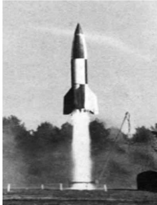
Imágenes de V-1 y V-2 alemanas

Esta extraña sensación de superioridad, se veía reforzada bajo las tesis de la denominada “Doctrina Truman”, que suponía, grosso modo, el evitar y entrar en clara competencia con la URSS en cuanto a desarrollo o expansión en cualquiera de las facetas posibles.