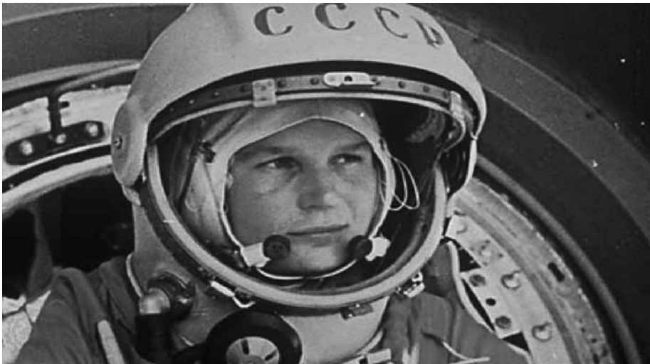
Yuri Gagarin

En 1961, la sensación de temor y de fracaso estadounidense se acrecentó aún más, cuando los soviéticos consiguieron llevar al primer hombre al espacio. Se trataba de Yuri Gagarin, militar soviético, que con una variante modernizada del cohete que puso el primer satélite en el espacio, fue capaz de llevar y hacer regresar al primer hombre al espacio.