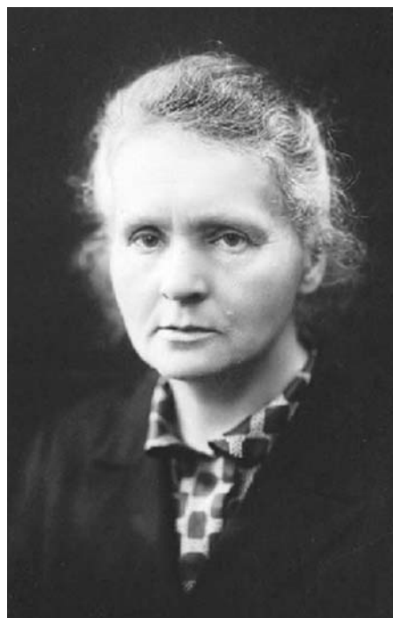
Figura 1. Marie Curie en 1920.

Se graduó a los 15 años y decidió continuar su formación. Pero en aquella época, la Universidad de Varsovia no aceptaba mujeres. Su objetivo era estudiar ciencias por lo que tomó la decisión de trasladarse a París con la ayuda económica de su hermana. Fue la primera mujer en matricularse en la Facultad de Física de la Sorbona en 1891. Aún