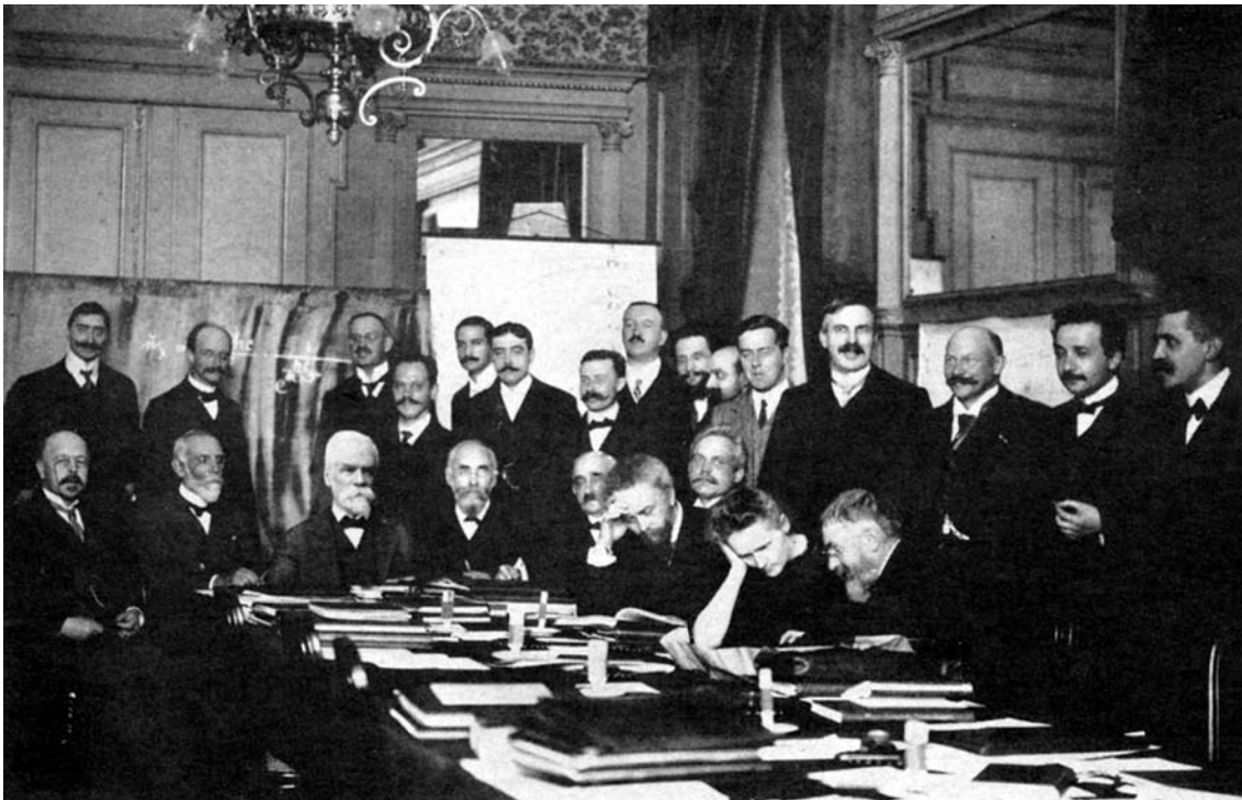
Figura 4. Marie Curie junto a los científicos más prestigiosos de las primeras décadas del siglo XX en la primera conferencia de Solvay, 1911.

La fama de Marie Curie se extendió rápidamente. Recibía diplomas y honores de distintas academias extranjeras. Aunque no fue admitida como miembro de la Academia Francesa de Ciencias, Suecia le concedió el Premio Nobel de Química en el año 1911. Durante más de cincuenta años no hubo nadie, que mereciera esta recompensa por segunda vez.